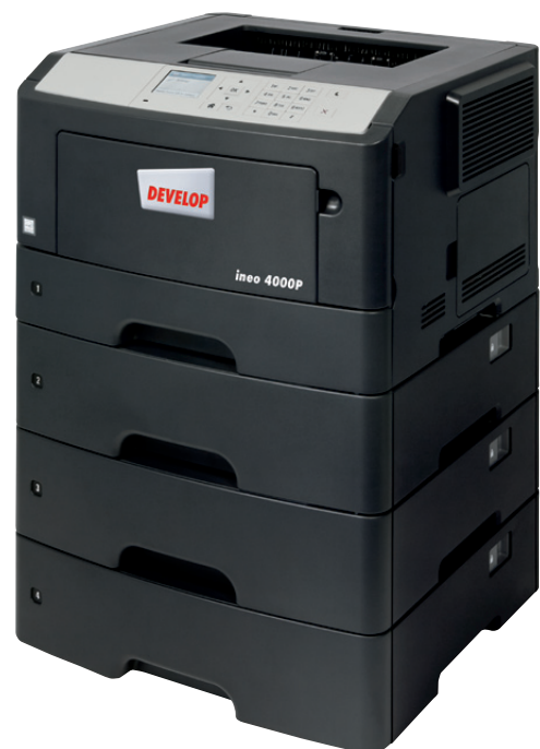
ineo 4000P mit drei zusätzlichen Papierkassetten (PF-P12)

Ist Ihr derzeitiges Drucksystem unübersichtlich und schwer zu bedienen? Dann steigen Sie um auf die ineo 4000P. Das 2,4-Zoll Farbdisplay ist intuitiv zu bedienen und hervorgehobene Menüs zeigen dem Benutzer den Systemstatus sowie Bedienungsoptionen und -einstellungen. Mehr noch – die Navigation über Ordnerstrukturen ist übersichtlich und erleichtert Ihnen die Bedienung. Der Bedienkomfort wird Sie und Ihr Team sofort positiv beeindrucken und es bleibt mehr Zeit für die wichtigen Kernaufgaben. Und bei der ineo 4000P brauchen Sie kein umfangreiches Bedienungshandbuch zu fürchten: sie lässt sich intuitiv bedienen.